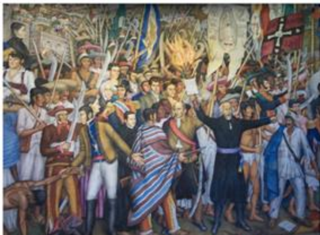
Detalle de un mural representativo de la Independencia de México, realizado por el pintor mexicano Juan O'Gorman. Se encuentra en el Castillo de Chapultepec.

Se conoce como Independencia de México al proceso de liberación del territorio colonial de Nueva España . Este proceso duró 11 años , ya que comenzó el 16 de septiembre de 1810 , con el Grito de Dolores, y finalizó en 1821 , luego de que Vicente Guerrero y Agustín de Iturbide firmaran el Plan de Iguala y el Ejército Trigarante entrara de manera triunfal en la Ciudad de México. Durante esos 11 años, los independentistas debieron librar gran cantidad de combates contra el ejército realista, que fue apoyado por muchos criollos, quienes temían que la guerra por la Independencia se transformara en una guerra social.