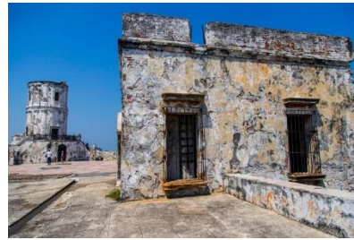
Cárcel de San Juan de Ulúa.