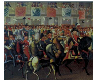
Entrada del generalísimo don Agustín de Iturbide a México, el 27 de septiembre de 1821, siglo XIX, anónimo.

Consumación (1821): la consumación de la Independencia tuvo lugar en 1821, cuando un antiguo realista, Agustín de Iturbide, pactó con los insurgentes y proclamó el Plan de Iguala, documento que declaró a México como Estado independiente. Poco después, patriotas y realistas firmaron los Tratados de Córdoba, por el cual el capitán general de Nueva España, Juan O' Donojú, reconoció a México como una nación soberana e independiente.