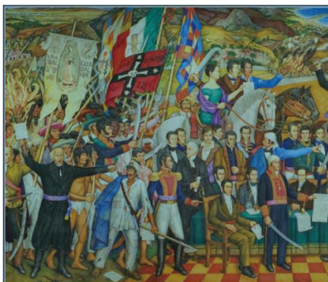
Detalle del Retablo de la Independencia que Juan O'Gorman pintó entre 1960 y 1961. Es un fresco que se encuentra en el Museo Nacional de Historia de la Ciudad de México